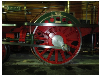
Triebradsatz D 1/3 Spanisch Brötli Bahn Lok