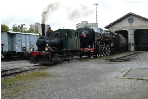
David und Goliath vor Depot 1892

Im Jahre 2006 wurde die Stiftung Bahnpark Region Brugg gegründet, die die alten Anlagen wieder zu Leben erweckte. Eine neue Heimat für historische Dampflokomotiven, verbunden mit viel Herzblut der verschiedensten Vereine lässt die vergangene Zeit wieder aufleben. In tausenden von Stunden entstanden in Gebäuden, Infrastruktur und Fahrzeuge, das was man heute als museal wieder bewundern kann.