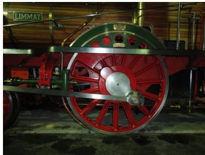
Triebradsatz D 1/3 Spanisch Brötli Bahn Lok

Der Bahnhof Brugg ist im Besitze einer historischen Depotanlage, die wurde seit Jahren nicht mehr zweckmässig genutzt. Heute beherbergt die Stiftung Bahnpark Brugg 7 Dampfloks, 1 Diesel und 3 Elektrolokomotiven, alle sind historisch und in betriebsfähigem Zustand. Viele eisenbahntechnische Einrichtungen bereichern das Museum, z.B. eine 18 m Drehscheibe Baujahr 1905, Radsatz Drehbank Baujahr 1892, mechanische Signale, Lok-Einrichtungen, Modelllokomotiven M 1:10, in Vitrinen aufgearbeitete Laternensammlung und vieles mehr.