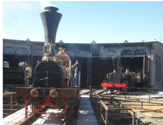
Historischer Lokwechsel im Bahnpark