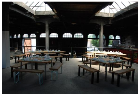
Blick von der Apérobühne