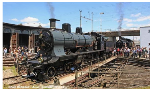
Tag der offenen Tore jeweils im Juni