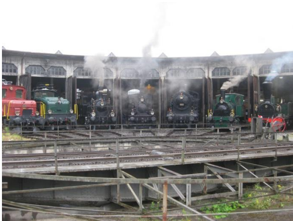
Lokparade August 2009

Der Bahnhof Brugg ist im Besitze einer historischen Depotanlage, die wurde seit Jahren nicht mehr zweckmässig genutzt. Heute beherbergt die Stiftung Bahnpark Brugg 7 Dampfloks, 1 Diesel und 3 Elektrolokomotiven, alle sind historisch und in betriebsfähigem Zustand. Viele eisenbahntechnische Einrichtungen bereichern das Museum, z.B. eine 18 m Drehscheibe Baujahr 1905, Radsatz Drehbank Baujahr 1892, mechanische Signale, Lok-Einrichtungen, Modelllokomotiven M 1:10, in Vitrinen aufgearbeitete Laternensammlung und vieles mehr.